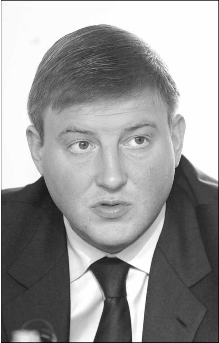
Политик Андрей Турчак.

Андрея Турчака назвали заказчиком избиения Олега Кашина