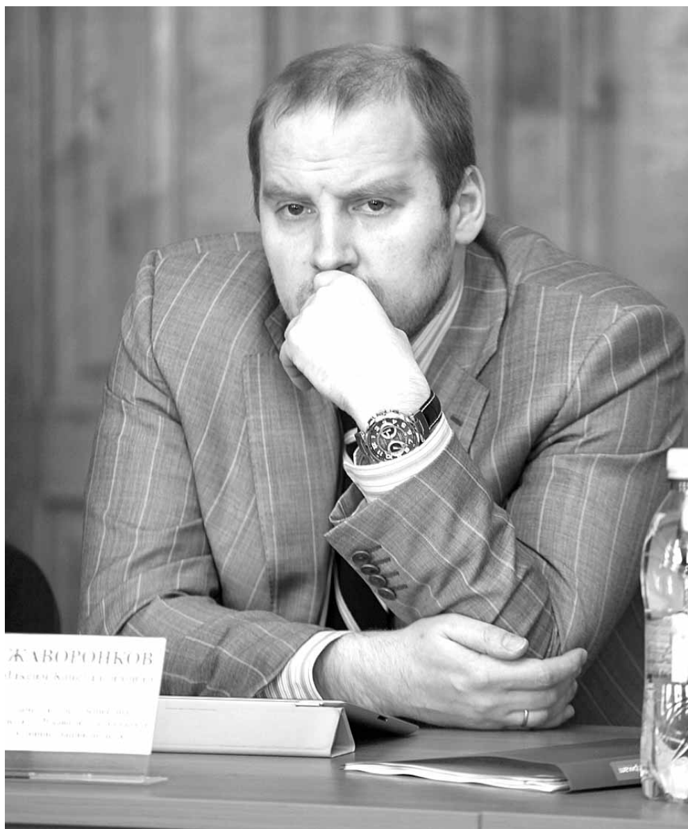
Максим Жаворонков, заместитель губернатора Псковской области.