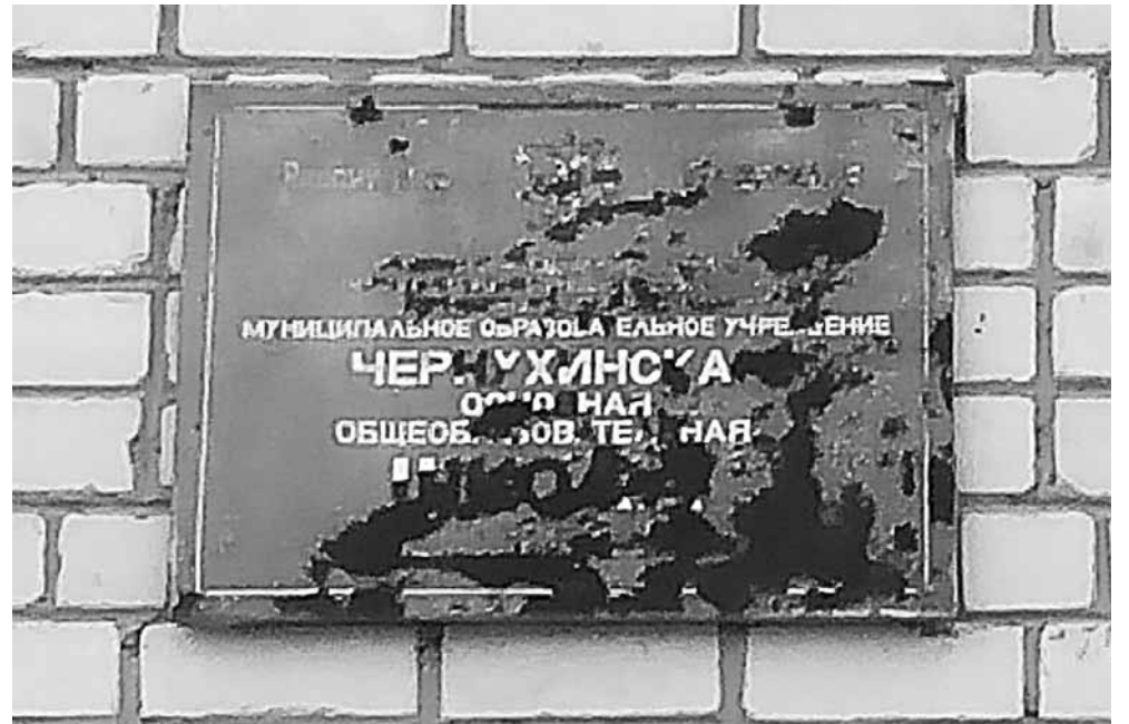
Вывеска ныне закрытой основной школы в деревне Чернуха Невельского района.