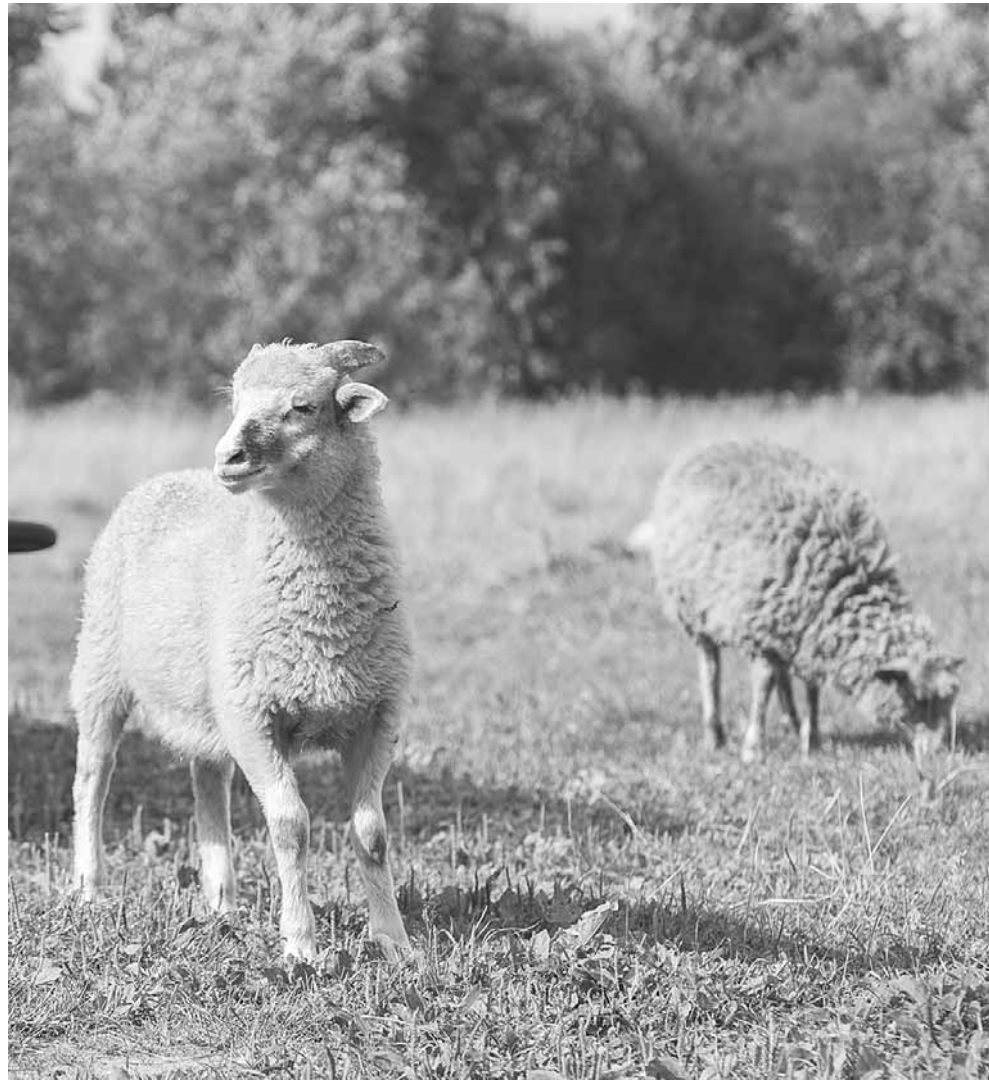
Государство решило теперь считать незаконным подворный забой скота, что сделало невыгодным домашнее животноводство.

В отдельных регионах был разговор о государственных субсидиях для открытия боен. Но в Псковской области, где сельское хозяй-