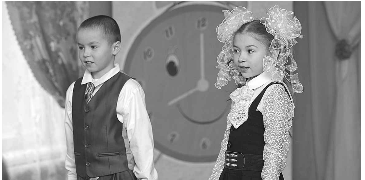
Ученики спасённой от закрытия Харлаповской средней школы празднуют её 135-летний юбилей.

Потому что отпущенных финансовых лимитов хватит только на амбарный замок – символ финала.